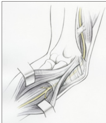
Verlauf des Ellenervs durch den Kubitaltunnel

Das KUTS, häufig auch als Ulnarisrinnensyndrom, Sulkus-ulnaris-Syndrom oder UNE (Ulnarisneuropathie am Ellenbogen) bezeichnet, ist ein Beschwerdebild im Rahmen einer Druckschädigung des Ellenervs im Bereich des Ellenbogengelenks, bzw. genauer im Ellenbogengelenkstunnel (=Kubitaltunnel).